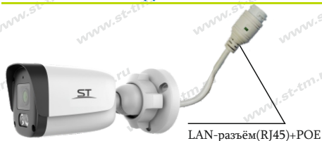
Рис.1 Схема подключения видекамеры